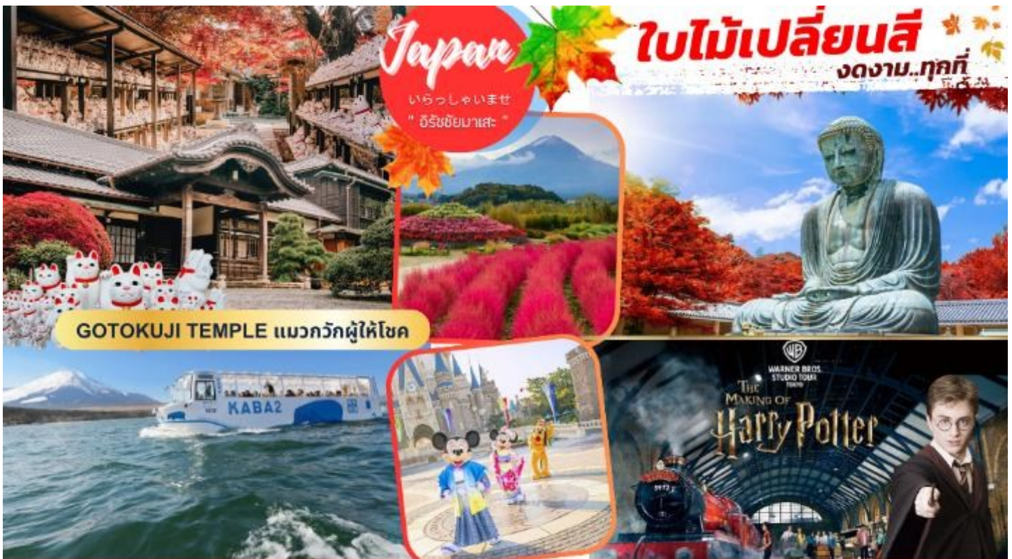
GOTOKUJI TEMPLE แมวภักผู้ให้โชค

คามาคูระ - พระใหญ่โตบุตสึ - โทเทมบะเจ้าท์เล็ก ภูเขาไฟฟูจิ - ออนเซน - บุฟเฟ่ต์ซาปูไม่อื่น