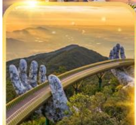
สะพานมือยักษ์