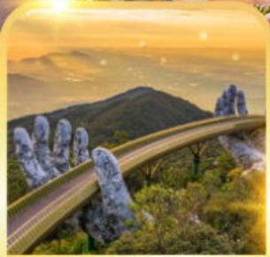
สะพานมือยักษ์

ดานัง ฮอยอัน บานาฮิลล์ เที่ยวบานาฮิลล์เต็มวัน รวมบัตรเครื่องบิน