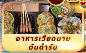
อาหารเวียดนาม ดินตำรับ