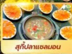
สุกัปลาเซลมอน