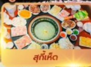
สุกัเห็ด