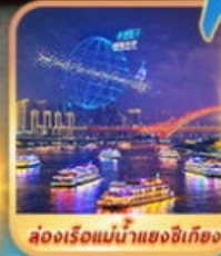
ล่องเรือแม่น้ำแยงซีเกียง