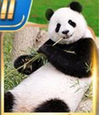
สวนสัตว์จงชิ่ง