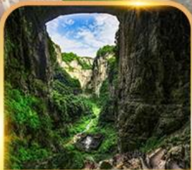
อุทยานหลุมฟ้า 3 สะพานสวรรค์