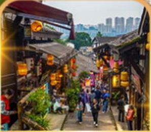
หมู่บ้านโบราณฉือชี่โจว