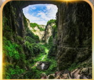
อุทยานหลุมฟ้า 3 สะพานสวรรค์