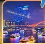
ล่องเรือแม่น้ำแยงซีเกียง