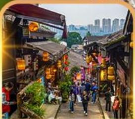
หมู่บ้านโบราณฉือชี่โจว