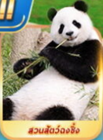
สวนสัตว์จงชิ่ง