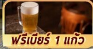
ฟรีเบียร์ 1 แก้ว