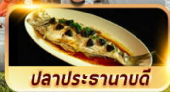
ปลาประรานาบดี