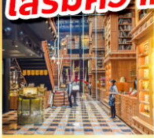
ร้านไอศกรีมมียาฮ่า