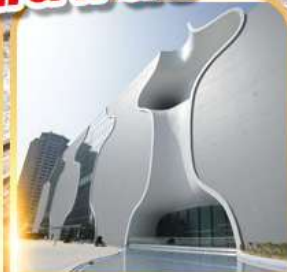
โรงละครโดง