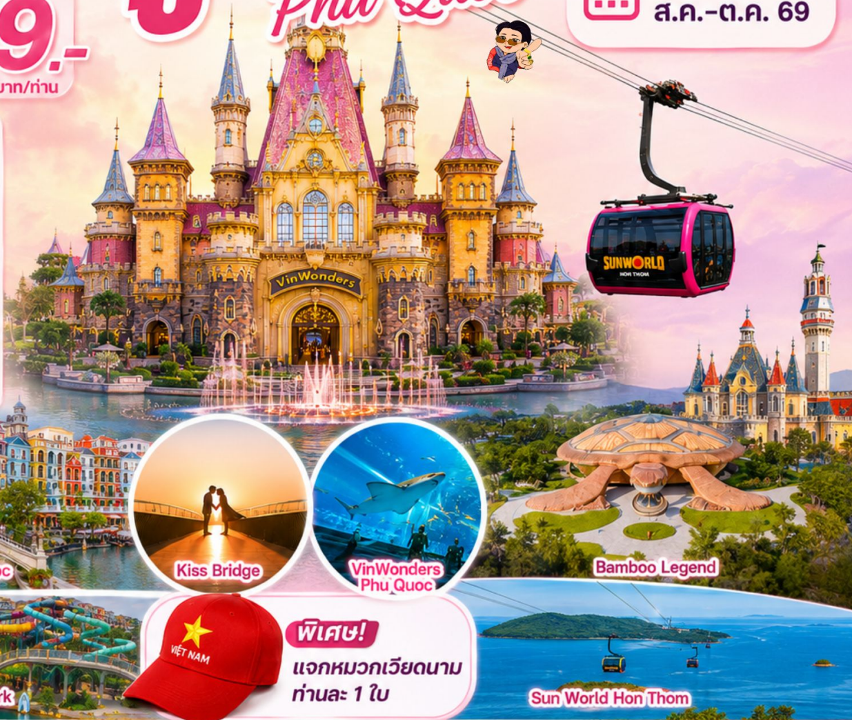
Venice Phu Quoc