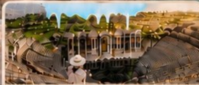
เมืองเซียราโพลิส