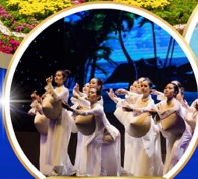
Charming Danang Show