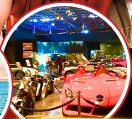
Royal Automobile Museum