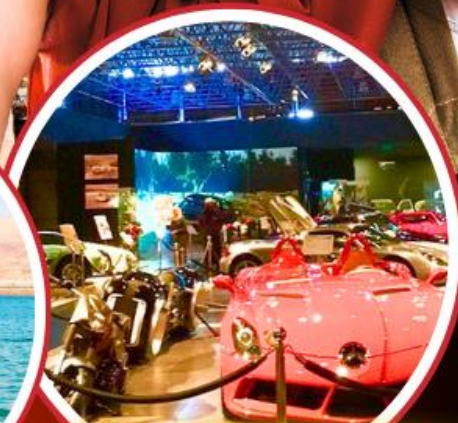
Royal Automobile Museum