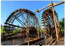
สวนกังหันวิดน้ำโบราณ

08.25 น. ออกเดินทางสู่เมืองหลานโจว เที่ยวบิน CZ8985 11.35 น. เดินทางถึงสนามบินหลานโจวจางซาน