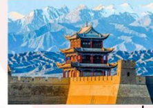
กำแพงเมืองด่านเจียอี้กวน

** พักที่ Cheng Feng Hotel 4* หรือเทียบเท่า **