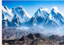
เทือกเขาเทียนชาน