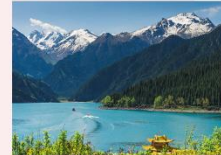
ร่องเรือทะเลสาบเทียนฉือ