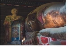
วัดพระใหญ่จางเย่