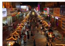
ตลาดซาโจว

** พักที่ Mercure Hotel 4* หรือเทียบเท่า **