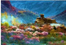
ป้อมปราการ Altit Fort

DAY4 CHERRY BLOSSOM-ป้อมปราการอัลติท-ตลาดพื้นเมือง- ฮอปเปอร์ กลาเซียร์-หุบเขาคฺยเกออร์