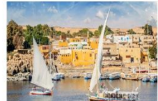
Option ล่องเรือเฟลกะ หรือ ล่องเรือชมหมู่บ้าน Nubian Village

** พักที่ Royal Beau Rivage Nile cruise 5* หรือเทียบเท่า **