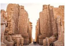
มหาวิหารคาร์นัค

xx.xx น. ออกเดินทางสู่เมืองลักซอร์ โดย Egypt Airlines เที่ยวบิน... xx.xx น. เดินทางถึงสนามบินลักซอร์