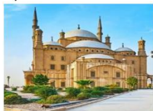
Salah EL Din Citadel & Mohamed Ali Mosque

** พักที่ Movenpick Cairo Hotel 5* หรือเทียบเท่า **