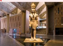
Grand Egyptian Museum

** พักที่ Movenpick Cairo Hotel 5* หรือเทียบเท่า **