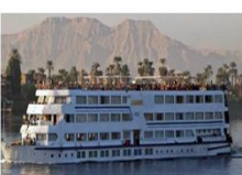
เรือสำราญแม่น้ำไนล์