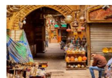
ตลาดชานเอลคาลีลี

20.50 น. ออกเดินทางสู่อิสตันบูล เที่ยวบิน TK695