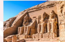
มหาวิหารอาบูซิมเบล