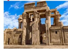
วิหารคอมมอโบ