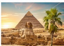
มหาพีระมิดกิซา