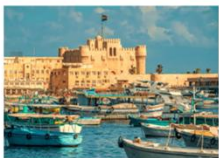
เมืองอเล็กซานเดรีย