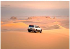
Jeep 4WD สู่ Faiyum