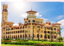
พระราชวังอัลมอนตาซาร์

** พักที่ Movenpick Cairo Hotel 5* หรือเทียบเท่า **