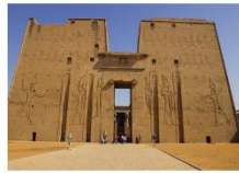
วิหารเอ็ดฟู