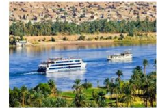
พักผ่อนตามอัธยาศัยบนเรือสำราญ

** พักที่ Royal Beau Rivage Nile cruise 5* หรือเทียบเท่า **