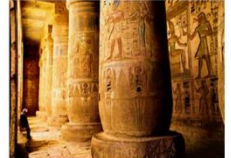
วิหารมาดินัตฮาบู

** พักที่ Royal Beau Rivage Nile cruise 5* หรือเทียบเท่า **