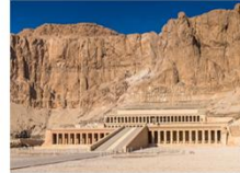
หุบผากษัตริย์