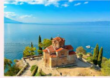
St. John at Kaneo Church ป้อมปราการซามูเอล