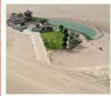
เป็นทรายหิมิงซาซาน