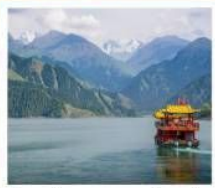
ช่องเรือทะเลสาบเทียนฉือ