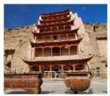
ถ้ำม่อเถา