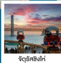
จัตุรัสซิงไห่