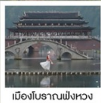
เมืองโบราณฟังหวง