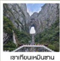
เขากียนเหมินซาน