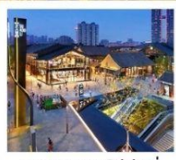
ถนนคนเดินไท่กุ่หฺลี่