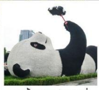
รูปปั้นแพนด้าเซลฟี่