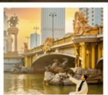
ย่านอิตาลี