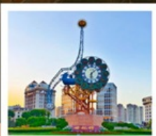
นาฬิกาตวรรษ