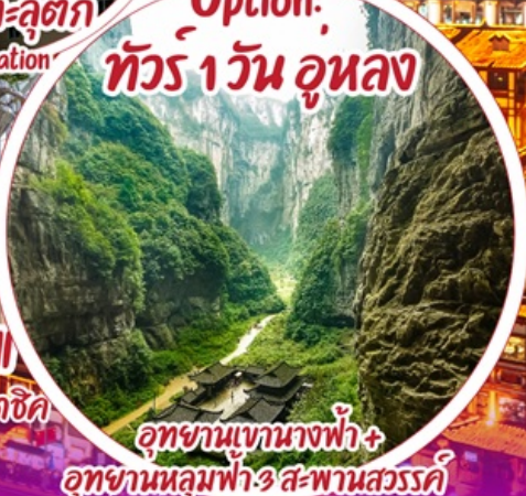
อุทยานเขานางฟ้า + อุทยานหลุมฟ้า 3 สะพานสวรรค์