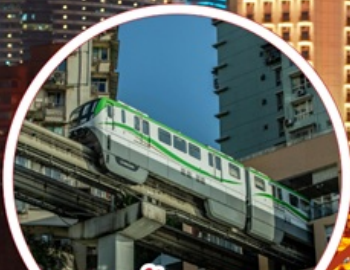
รถไฟฟ้า-ลูตึก Liziba Station