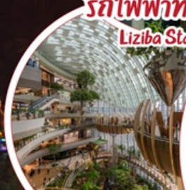
The Ring Mall ช้อปปิ้งศูนย์รวมสินค้าสุดฮิต