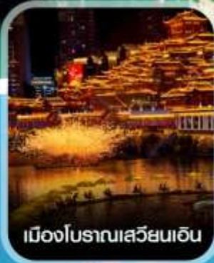
เมืองโบราณเสวียนเอน