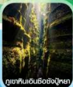
ภูเขาหินเอนซือชังปู้หย่า