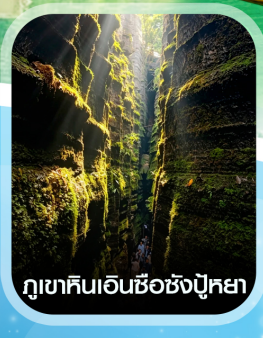
ภูเขาหินเอ็นชื้อซังปู้หยา

คอนเฟิร์ม ออกเดินทาง ทุกพีเรียด 2 ท่านขึ้นไป