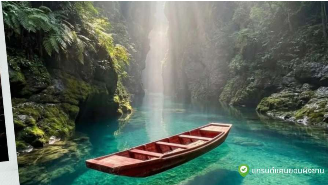
แกรนด์แคนยอนผิงซาบ