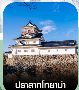
ปราสาทโทยาม่า