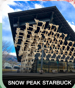
SNOW PEAK STARBUCK