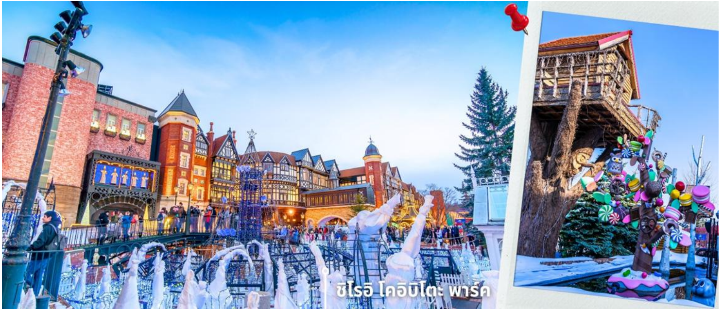
ชิโรอิ โคอิบิตะ พาร์ค

**การประดับไฟในฤดูหนาวและการเปิดไฟขึ้นอยู่กับช่วงเวลาและกำหนดการของสถานที่ที่ไม่สามารถรันตีได้**