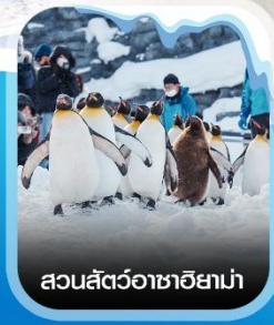
สวนสัตว์อาซาฮยาม่า