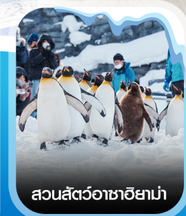
สวนสัตว์อาซาฮยาม่า

มกราคม - มีนาคม 2570 ราคาเริ่มต้น 44,899