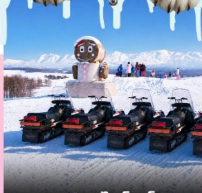
ลานสกีชิโกชิโนะโอกะ