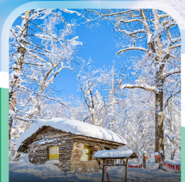
ภาพวาดสีบลู