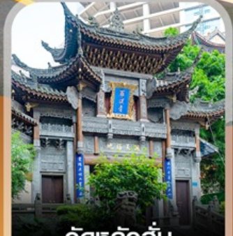
วัดหลิวอัน