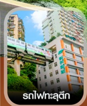
รถไฟทะลุтик

✈️ คอนเฟิร์มออกเดินทาง ทุกพีเรียด 2 ท่านขึ้นไป