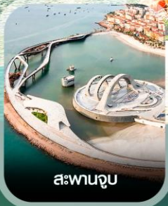
สะพานจูบ

✈️ คอนเฟิร์ม ออกเดินทาง ทุกพีเรียด 2 ท่านขึ้นไป