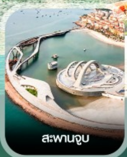
สะพานจูบ

✈️ คอนเฟิร์มออกเดินทาง ทุกพีเรียด 2 ท่านขึ้นไป