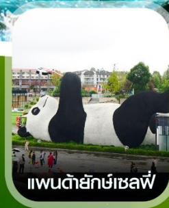
แพนด้ายักษ์เซลฟ์

คอนเฟิร์ม ออกเดินทาง ทุกพีเรียด 2 ท่านขึ้นไป