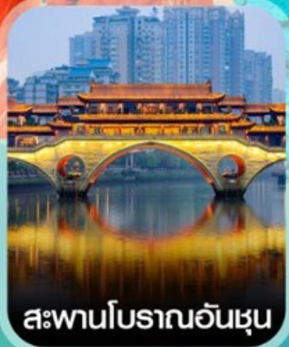
สะพานโบราณอันชุน