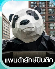
แพนด้ายักษ์ปิ่นตึก