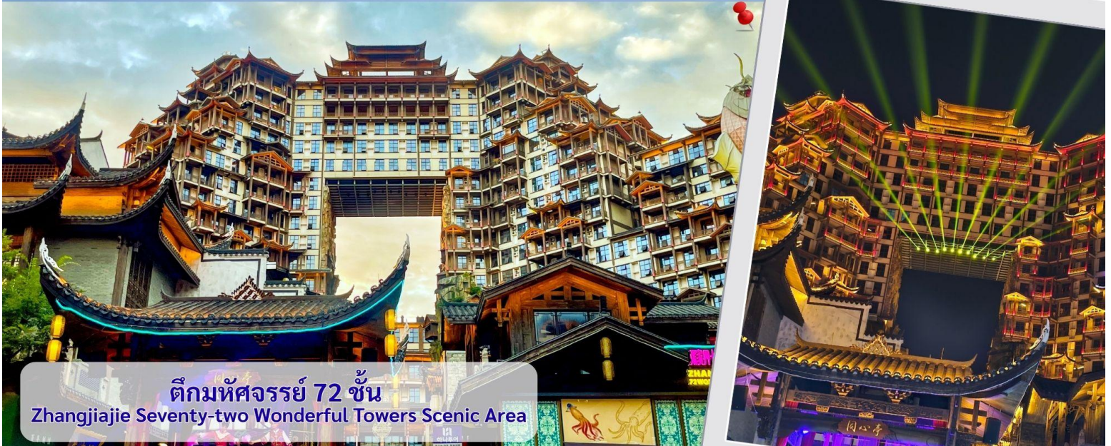
ตึกมหัศจรรย์ 72 ชั้น Zhangjiajie Seventy-two Wonderful Towers Scenic Area

ให้ท่านได้แวะชมสินค้าผลิตภัณฑ์จากร้านยางพารา จากนั้นนำทุกท่านชมชมตึกมหัศจรรย์ 72 ชั้น จุดเช็คอินใหม่ล่าสุดของเมืองจางเจี๋ยเจี๋ย โดยการสร้างตึกในครั้งนี้เป็นการรวมเอาจุดเด่นของเมืองจางเจี๋ยเจี๋ยกับวัฒนธรรมการสร้างบ้านเรือนของชาวพื้นเมืองถู่เจี๋ยมารวมกันโดยอาคารสูงที่สร้างจำลอง เขาเทียนเหมินซานหรือประตูสวรรค์ และ บ้านยกพื้นโบราณที่เป็นบ้านพื้นเมืองของชาวถู่เจี๋ย ภายในบริเวณตึก 72 ชั้น ยังรวบรวม รีสอร์ท ร้านอาหาร สตรีทฟู้ด ร้านขายของที่ระลึก ที่ตกแต่งด้วยแสงสีสุดอลังการ ตั้งอยู่ใจกลางเมืองจางเจี๋ยเจี๋ย