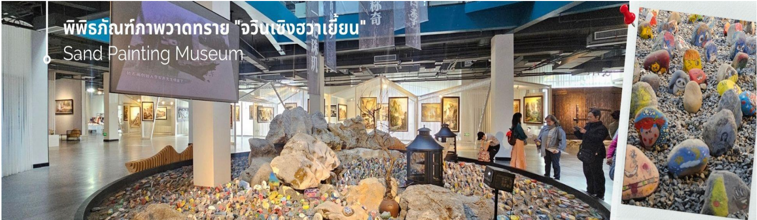
พิพิธภัณฑ์ภาพวาดทราย "จวินเซิงฮวาเยี่ยน" Sand Painting Museum

เช้า ๑๐) รับประทานอาหารเช้า ณ ห้องอาหารของโรงแรมที่พัก (6) พิเศษเมนู!! สุกี้เด็ด จากนั้นนำท่านแวะชมสินค้าจากร้านยาสมุนไพรจีน ให้ท่านได้เลือกซื้อผลิตภัณฑ์ยาสมุนไพรจีนเพื่อสุขภาพ จากนั้นนำท่านชม พิพิธภัณฑ์ภาพวาดทราย "จวินเซิงฮวาเยี่ยน" (Sand Painting Museum) พิพิธภัณฑ์ที่จัดแสดงภาพวาดของหลี่จวินเซิง ซึ่งเป็นผู้ที่ริเริ่มศิลปะแบบใหม่ที่เรียกกันว่า จิตรกรรมภาพเม็ดทราย ใช้วัสดุจากธรรมชาติ เช่น กรวดสี เม็ดทราย กิ่งไม้ หิน ฯลฯ มาจัดแต่งเป็นภาพทิวทัศน์จิตรกรรมที่รังสรรค์ขึ้นมา ล้วนได้รับรางวัลและการยกย่องมากมายหลายปีซ้อนจนเป็นที่เลื่องลือไปทั่วโลก