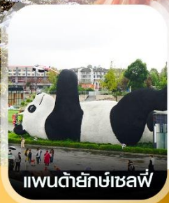
แพนด้ายักษ์เซลฟี

✈️ คอนเฟิร์ม ออกเดินทาง ✈️ ทุกพีเรียด 2 ท่านขึ้นไป