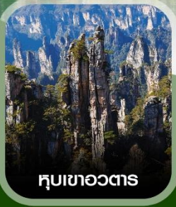
หุบเขาอวตาร

ฟรี ใส่ชุดชนเผ่าท้องถิ่น บัตรตรงลงจางเจียเจีย