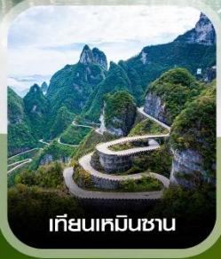
เทียนเหมินชาน

คอนเฟิร์ม ออกเดินทาง ทุกพีเรียด 2 ท่านขึ้นไป