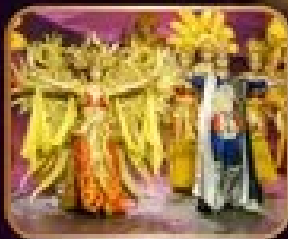
การแสดงโขนละคร