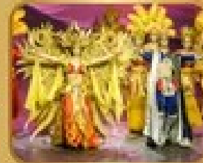
ชมการแสดงละครจีน