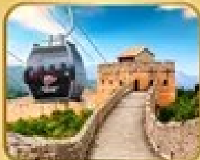
ถ่ายภาพเมืองจีน