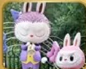
เที่ยวสวนสนุก