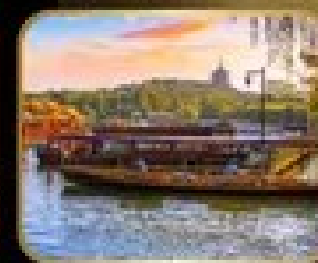
ล่องเรือ ทะเลสาบฉีหู