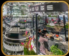
ภัตตาคารชื่อดัง WAREHOUSE NO.3