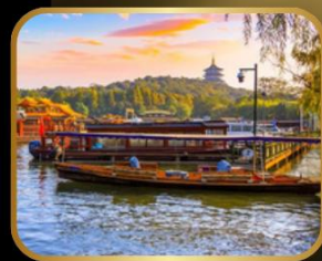
ล่องเรือ ทะเลสาบซีหู