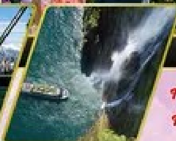
ล่องเรือมิลฟอร์ด ซาวน์