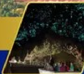
ท่าอากาศยานโอ๊คแลนด์