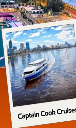
Captain Cook Cruises