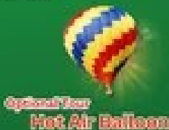
Optional Tour Hot Air Balloon