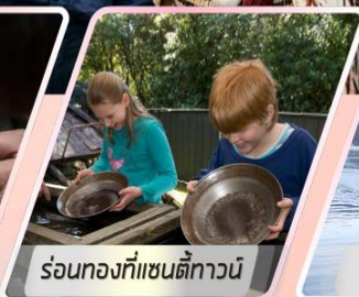
ร้อนทงที่แซนตีทาวน์