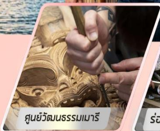
ศูนย์วัฒนธรรมเมารี