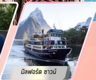
มิลฟอร์ด ซาวน์