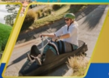
เล่นลู่ ที่ควีนส์ทาวน์

AUCKLAND / ROTORUA / CHRISTCHURCH FOX GLACIER / FRANZ JOSEF / QUEENSTOWN