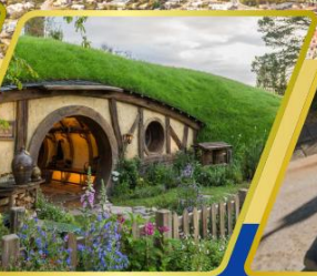
หมู่บ้านฮอบบิต