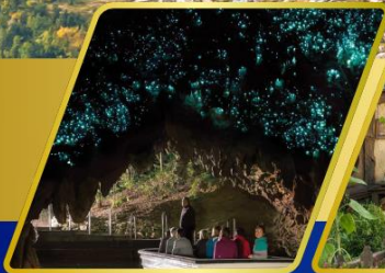
ถ้ำหอนเรื่องแสง