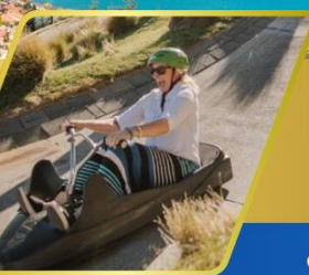
เล่นลู่ ที่ควีนส์ทาวน์

✈️ บินภายใน (เที่ยวสุดคุ้ม) พักโรงแรม 4 ดาว ★★★★★