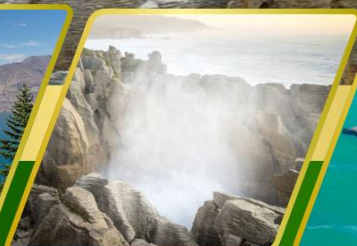
ไปโฮ, แพนเค็กหรือค