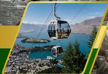
นั่งกระเช้ากอนโดล่า