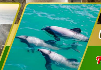
ล่องเรือชมโลมา