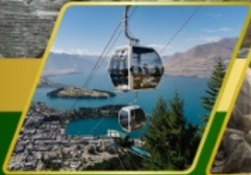
นั่งกระเช้ากอนโดล่า