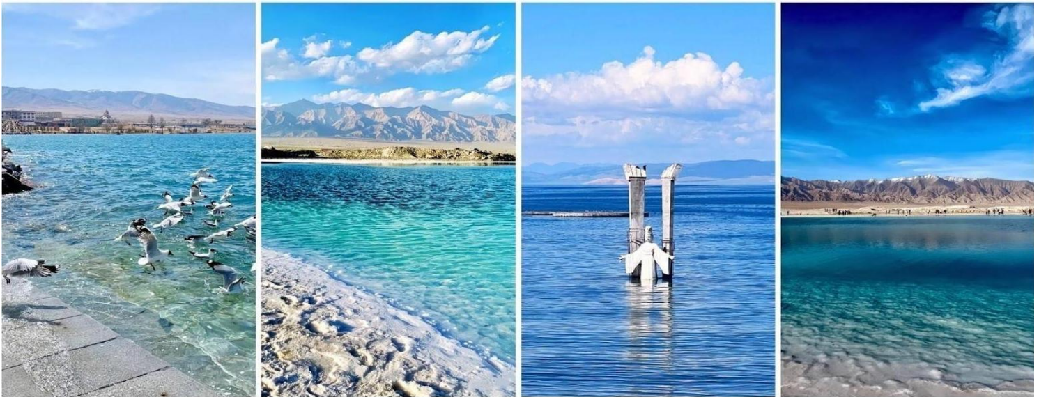
ทะเลสาบชิงไห่ (Qinghai Lake)

นำท่านเดินทางสู่ ทะเลสาบชิงไห่ ใช้เวลาเดินทางประมาณ 2 ชั่วโมง จากนั้นนำท่านชม ทะเลสาบชิงไห่ (Qinghai Lake, 青海湖) ที่ขึ้นชื่อว่าเป็นทะเลสาบน้ำเค็มที่ใหญ่ที่สุดในประเทศจีนและยังใหญ่เป็นอันดับต้นๆของเอเชีย โดยมีพื้นที่ประมาณ 4,657 ตารางกิโลเมตร ตั้งอยู่บนที่ราบสูงชิงไห่ทิเบตที่มีความสูงเหนือระดับน้ำทะเลประมาณ 3,196-3,200 เมตร ที่ตั้งของทะเลสาบแห่งนี้ได้ถูกรายล้อมไปด้วยเทือกเขาทั้งหมด 4 ลูกด้วยกัน ได้แก่ เทือกเขา ต่าตง Datong Mountain อยู่ทางทิศเหนือ, เทือกเขารือเยว่ Riyue Mountain อยู่ทางทิศตะวันออก, เทือกเขาชิงไห่ หนานซาน Qinghai Nanshan Mountain อยู่ทางทิศใต้, เทือกเขาเซียงผี Xiangpi Mountain อยู่ทางทิศตะวันตก ชาวมองโกลเรียกทะเลสาบแห่งนี้ว่า คูกู นอร์ (Kökö Noor) ชาวทิเบตเรียกทะเลสาบแห่งนี้ว่า โซ กอนโป (Tso Ngonpo) แต่ทั้งสองชื่อเรียกนี้ต่างก็มีความหมายว่า ทะเลสาบสีฟ้า แดงที่นี้ยังถือเป็น สถานที่ศักดิ์สิทธิ์ในพระพุทธศาสนาทิเบต ท่านจะได้ชื่นชมความงามของทุ่งหญ้าสีเขียวขจีอันกว้างใหญ่ซึ่งเป็นที่อยู่อาศัยของสัตว์ป่าและนกอพยพจำนวนมาก ตัดกับความงดงามของผืนน้ำสีฟ้า อันเข้มข้นและท้องฟ้าสีครามอันกว้างไกลบนที่ราบสูง จนที่นี่ได้รับการยกย่องว่าเป็น หนึ่งในทะเลสาบที่สวยงามที่สุดแห่งหนึ่งของประเทศจีน