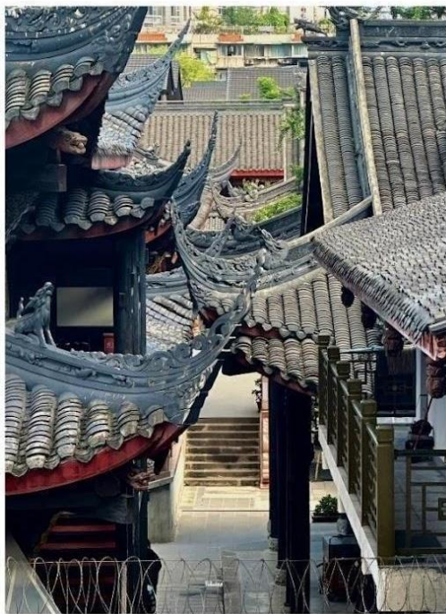
วัดต้าจื่อ