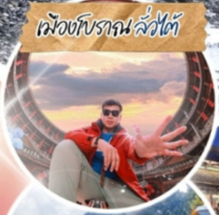
เมืองโบราณ ลั่วโถ้ว