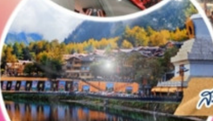
สะพานหนานหนานเฉียว