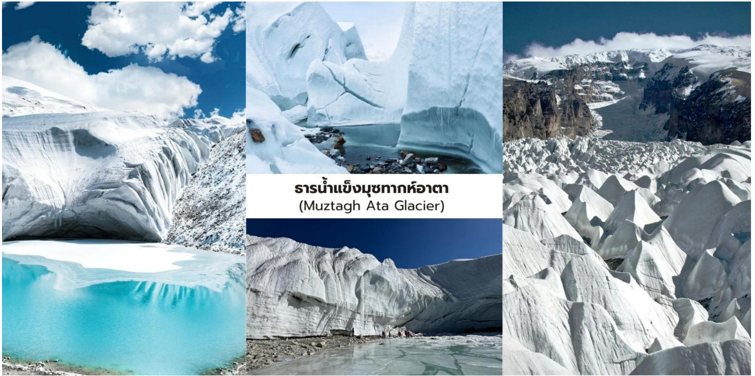
ธารน้ำแข็งมุขทากห้อตา (Muztagh Ata Glacier)

จากนั้นนำท่านเดินทางต่อสู่ เมืองทาชเคอร์กาน (Tashkurgan) ระยะทางจากมุขทากห้อตาประมาณ 50 กิโลเมตร ใช้เวลาเดินทางราว 1 ชั่วโมง อำเภอทาชเคอร์กานเป็นเมืองชายแดนที่ตั้งอยู่บนความสูงประมาณ 3,000 กว่าเมตรเหนือระดับน้ำทะเล ซึ่งเป็นเขตปกครองตนเองของชนเผ่าทาจิกและมีชาวทาจิกอาศัยอยู่เป็นประชากรส่วนใหญ่ของพื้นที่เมืองแห่งนี้ ด้วยความที่ตั้งอยู่ใกล้ชายแดนปากีสถาน ทาจิกิสถานและอัฟกานิสถานทำให้มีความสำคัญทั้งในด้านภูมิศาสตร์และวัฒนธรรมในอดีตพื้นที่แห่งนี้เคยเป็น จุดยุทธศาสตร์สำคัญบนเส้นทางสายไหม (Silk Road) ซึ่งใช้เป็นเส้นทางผ่านของพ่อค้าและนักเดินทางระหว่างจีนกับเอเชียกลาง ปัจจุบันแม้จะเป็นเมืองที่มีขนาดเล็ก แต่ก็ยังคงรักษาวรรณกรรม วิถีชีวิตและเอกลักษณ์ของชนเผ่าทาจิกท่ามกลางภูมิประเทศของที่ราบสูงปามิร์ที่งดงามและเจียบสงบ เมืองทาชเคอร์กานจึงถือเป็นหนึ่งในเมืองชายแดนที่มีเอกลักษณ์ทางชาติพันธุ์และประวัติศาสตร์บนเส้นทางสายไหมที่สะท้อนถึงการผสมผสานของวัฒนธรรมจีนและเอเชียกลางได้อย่างน่าสนใจ.