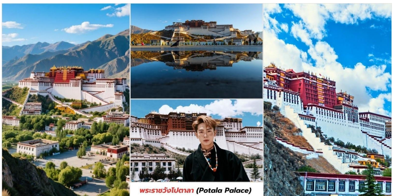
พระราชวังโปตาลา (Potala Palace)

นำท่านชม พระราชวังโปตาลา (Potala Palace, 布达拉宫) ตั้งอยู่กลางเมือง ลาซา (Lhasa) เมืองหลวงของเขตปกครองตนเองทิเบต (西藏自治区) ประเทศจีน เป็นพระราชวังเก่าแก่ที่ตั้งตระหง่านอยู่บนยอดเขา มารโปรี (Marpo Ri, 红山) สูงประมาณ 3,700 เมตรเหนือระดับน้ำทะเลและมีความสูงจากพื้นถึงยอดอาคารกว่า 117 เมตร ทำให้มองเห็นได้จากทุกมุมของเมืองพระราชวังโปตาลาดูยกย่องให้เป็น "หัวใจแห่งลาซา" และ "สัญลักษณ์