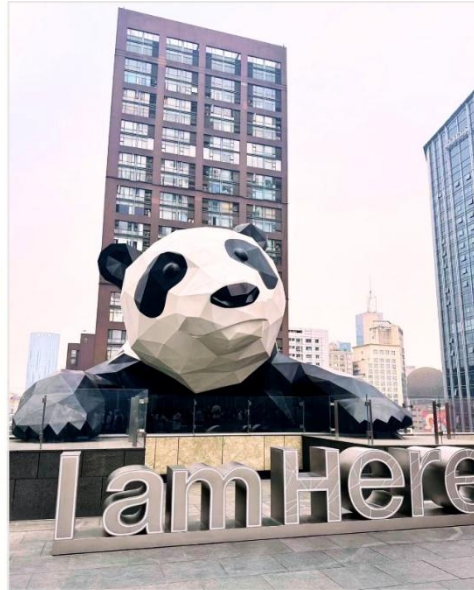
หมีแพนด้ายักษ์ กำลังป็นตึก IFS