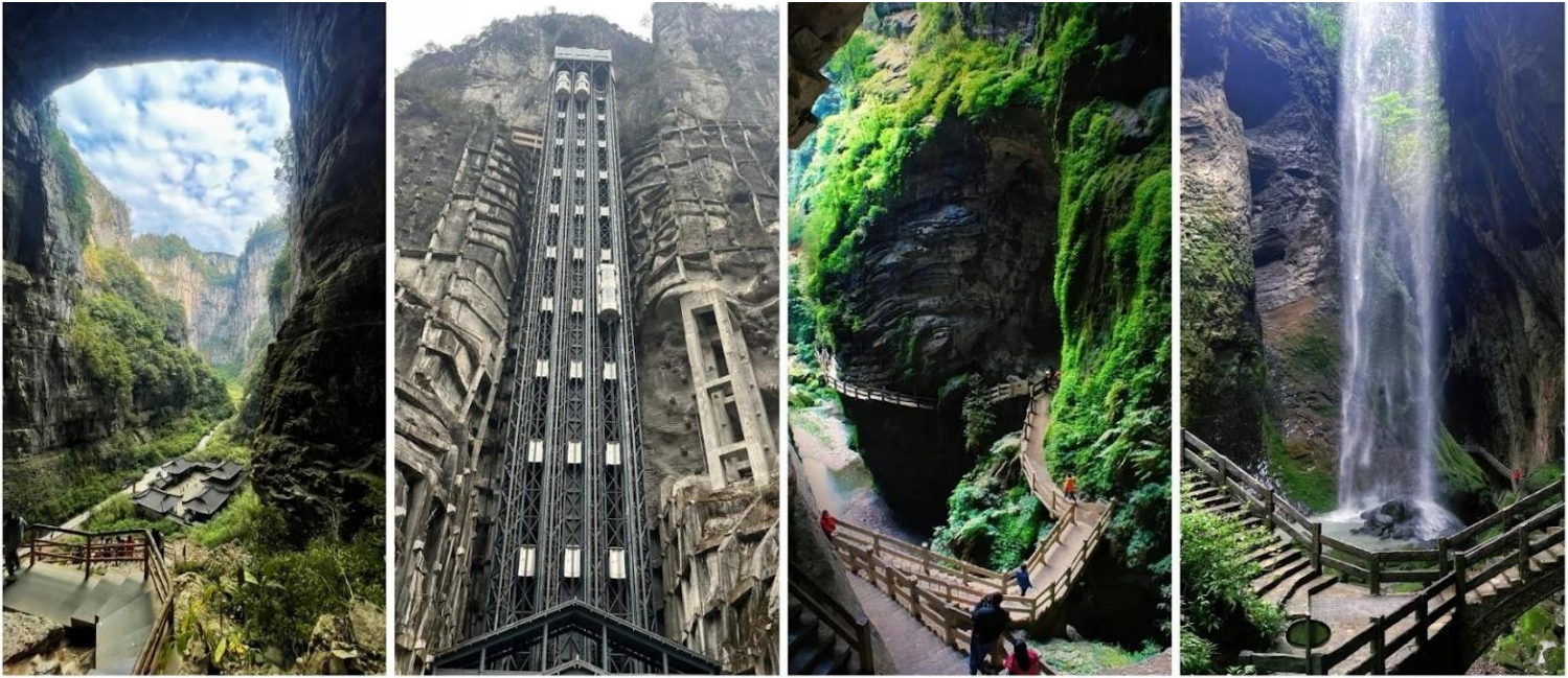
อุทยานแห่งชาติหลุมฟ้าสะพานสวรรค์

นำท่านชม อุทยานหลุมฟ้า สะพานสวรรค์ (Wulong Tiankeng Three Natural Bridges, 天生三桥) มรดกโลก (UNESCO World Heritage) ที่รวบรวมความยิ่งใหญ่ ความลึกลับ และประวัติศาสตร์ไว้ในที่เดียว อุทยานแห่งนี้เป็นส่วนหนึ่งของ Wulong Karst เกิดจากการยุบตัวของเปลือกโลกและการกัดเซาะของน้ำใต้ดินมานานหลายล้านปี จนเกิดเป็นหลุมยุบขนาดมหึมา (Tiankeng) 2 หลุม และมีสะพานหินปูนธรรมชาติ 3 แห่งเชื่อมต่อกัน ซึ่งถือเป็นกลุ่มสะพานธรรมชาติที่ใหญ่ที่สุดในเอเชียตะวันออกเฉียงใต้ นอกจากนี้ความสำคัญทางธรณีวิทยาแล้ว