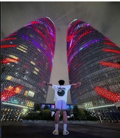
ตึกแฝดเทียนฟู่ (Tianfu International Financial Center Towers)