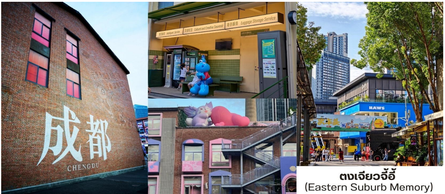
ตงเจียวจี้ (Eastern Suburb Memory)

บ่าย จากนั้นนำท่านเดินทางสู่เมือง เฉิงตู ใช้เวลาเดินทางประมาณ 1 ชั่วโมง