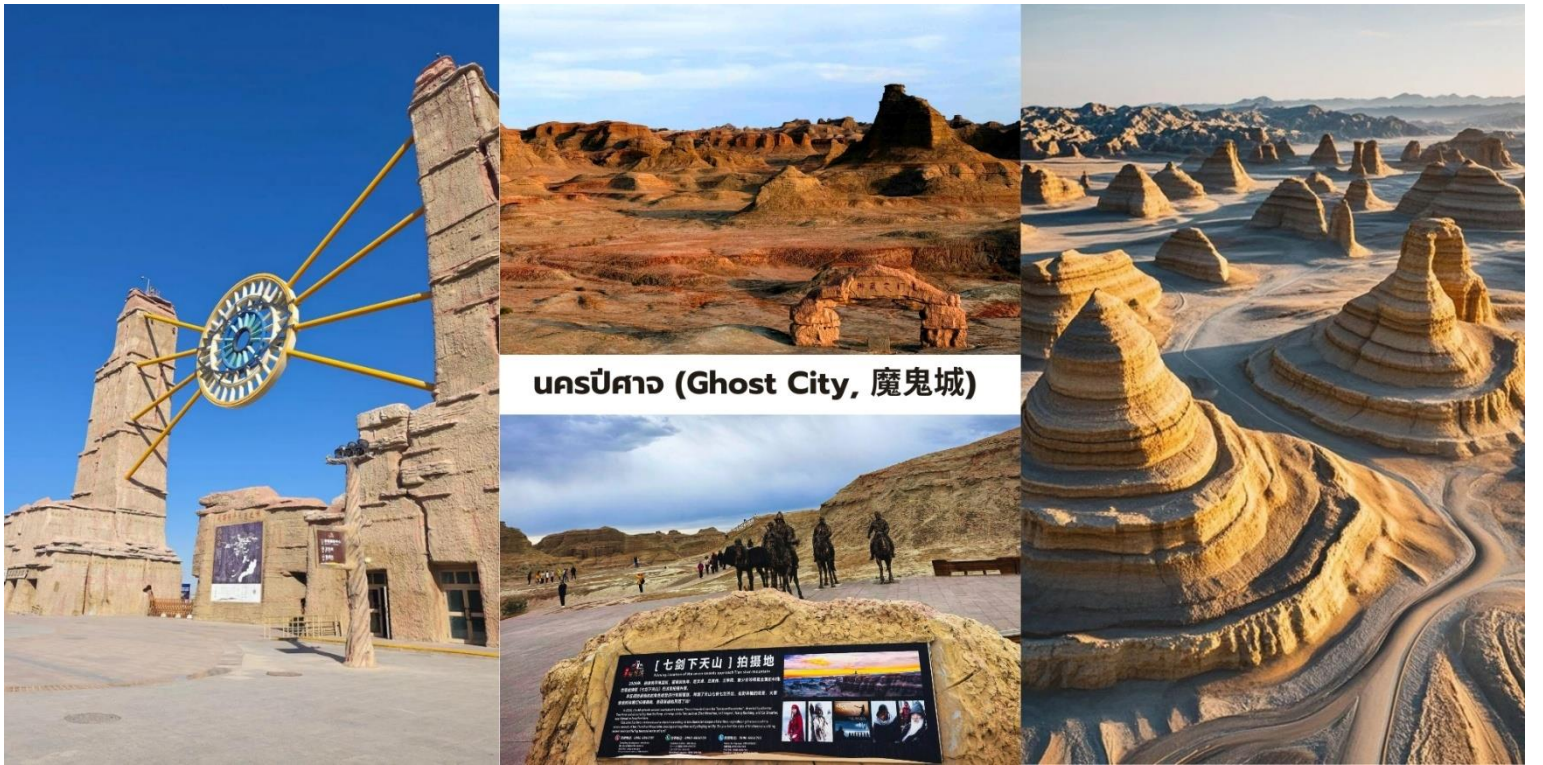
นครปีศาจ (Ghost City, 魔鬼城)

นำท่านชม นครปีศาจ (Ghost City, 魔鬼城) เมืองปีศาจแห่งทะเลทราย เสียงลมและหินแห่งทะเลทราย ความงามเหมือนจริงของซินเจียงที่ยืนยันถึงพลังอันยิ่งใหญ่ของธรรมชาติ ที่นี้ไม่ได้เป็นเพียงภูมิประเทศที่แห้งแล้ง แต่คือห้องเรียนทางธรณีวิทยาที่มีชีวิต นครปีศาจแห่งนี้คือแหล่งรวมปรากฏการณ์ "ภูมิประเทศแบบหย่าตัน" ที่ใหญ่และได้รับการอนุรักษ์ดีที่สุดแห่งหนึ่งในโลก คำว่า "หย่าตัน" (Yardang) เป็นคำศัพท์ทางธรณีวิทยาที่ใช้เรียก สันเขาหรือ โขดหินที่ถูกแกะสลักโดยกระบวนการกัดกร่อนจาก ลม (Wind Abrasion) และ น้ำ (Water Erosion) ในช่วงเวลาหลายล้านปี ทำให้เกิดประติมากรรมแห่งกาลเวลาโครงสร้างหินดินดานและหินทรายที่นี้ถูกสร้างขึ้น จากชั้นตะกอนในยุคครีเทเชียส (Cretaceous Period) ซึ่งเคยเป็นทะเลสาบน้ำจืดโบราณ เมื่อภูมิประเทศ ถูกยกตัว สูงขึ้น ลมทะเลทรายจึงเริ่มทำหน้าที่เป็นช่างแกะสลัก สร้างสรรค์ภูมิทัศน์ให้มีรูปลักษณ์คล้าย ปราสาทโกธิค, เรือรบโบราณ, สฟิงซ์, และป้อมปราการ ที่ยิ่งใหญ่เกินจินตนาการของมนุษย์ ปรากฏการณ์เสียงสะท้อน: ที่มาของชื่อ "นครปีศาจ" มาจากเสียงเมื่อลมแรงพัดผ่านช่องหินและหุบเหวที่ว่างเปล่าจะเกิดเสียงหวีดหวิวที่ดังอย่างต่อเนื่อง คล้ายเสียงถอน, เสียงดนตรีประหลาด, หรือเสียงคร่ำครวญ ซึ่งสร้างบรรยากาศลึกลับและน่าเกรงขามให้กับผู้มาเยือนความงามของ นครปีศาจนั้น แปรผันไปตามสภาพแสงและเงา ทำให้มันเป็นสวรรค์ของช่างภาพ ได้รับการยอมรับจาก วงการภาพยนตร์ จีนและฮอลลีวูด โดยถูกใช้เป็นฉากหลังสำหรับภาพยนตร์แนวประวัติศาสตร์และแฟนตาซีหลายเรื่อง เช่น "7กระบี่เทวดา (Seven Swords)" ทำให้ความรู้สึกเมื่อไปยืนอยู่ ณ ที่แห่งนี้เต็มไปด้วยจินตนาการและความยิ่งใหญ่